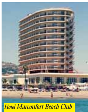
Hotel Marconfort Beach Club

Direttamente sulla spiaggia, a 500 mt. dai negozi, 200 mt. dai ristoranti, bar e trasporti pubblici. L'hotel offre agli ospiti reception 24 h, ascensore, cassetta di sicurezza, ristorante, bar, discoteca, ampio giardino, piscina per adulti e bambini, sauna, sala giochi, lavanderia, animazione e parcheggio (alcuni servizi con supplemento). Le camere dispongono di Tv-sat, telefono, A/C, balcone e cassetta di sicurezza con supplemento.