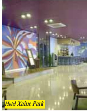
Hotel Xaine Park

Buon albergo situato nel centro di Lloret a 200 mt. dalla spiaggia. Dispone di ampi saloni, ristorante con servizio a buffet, cocktail bar, terrazza-solarium con bar e piscina (zona per bambini), sala Tv e video, sala giochi, sala conferenze e Club Xaine Mar con palestra. Camere con bagno, telefono e balcone (Tv con supplemento).