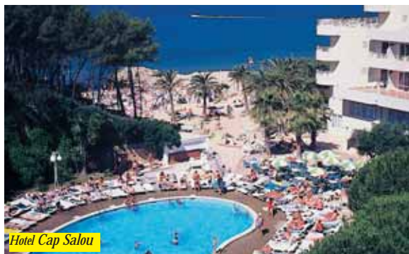
Hotel Cap Salou

Hotel situato in prima linea dalla spiaggia e 4 Km dal centro città, a cui è collegato tramite un servizio di bus. L'albergo offre ai clienti ristorante con servizio a buffet, 2 bar, sala Tv con antenna parabolica, giardino, piscina per adulti e bambini, jacuzzi, sauna, tennis, mini-golf con supplemento, sala giochi e animazione. Tutte le camere dispongono di bagno, balcone, telefono, Tv sat. e A/C dal 15/6 al 15/9.