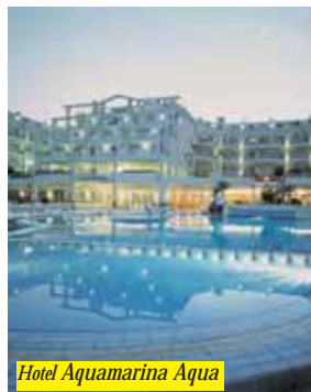
Hotel Aquamarina Aqua

Struttura posta in zona centrale, a soli 50 mt. dalla spiaggia. Offre agli ospiti: piscina, ristorante a buffet, bar, sala Tv, sala giochi, pub, animazione diurna e notturna e parcheggio esterno con supplemento. Camere con bagno, telefono, Tv, balcone, A/C e cassaforte opzionale.