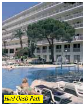
Hotel Oasis Park