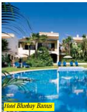
Hotel Bluebay Banus

L'Hotel Bluebay Banus si trova a Puerto Banus, a pochi passi dalla spiaggia e a 7 km dal centro di Marbella. Dispone di: ristorante, bar, reception 24h, giardino, cassetta di sicurezza, deposito bagagli, A/C, area fumatori, centro fitness, parco giochi per bambini, ping-pong, piscina all'aperto. Internet Wi-Fi è disponibile nelle aree pubbliche gratuitamente. Tutte le camere sono provviste di TV satellitare, A/C, frigorifero e cassetta di sicurezza.