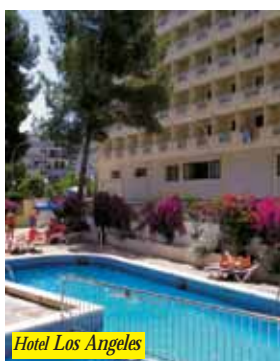
Hotel Los Angeles

Situato in Salou, a circa 250 mt dalla spiaggia e vicino al centro. L'hotel è formato da due edifici congiunti con due piscine per adulti e bambini, ristorante con A/C, sala Tv e caffetteria. Programma di animazione con serate danzanti e spettacoli folkloristici. Le camere hanno servizi privati, telefono e balcone.