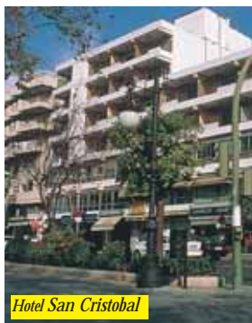
Hotel San Cristobal

Hotel posto nel centro di Marbella vicino al parco Alameda ed a 250 mt dalla spiaggia. Dispone di reception, saloni, bar, ristorante e sala Tv. Tutte le 97 camere sono dotate di servizi privati, cassaforte, telefono e Tv.