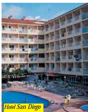
Hotel San Diego

Hotel situato a 400 mt. dalla Playa de Capellans e a 10 minuti dal centro. A disposizione degli ospiti giardino con parco giochi per bambini, piscina, bar, ristorante con servizio a buffet e A/C (15/06-15/09), Tv e sala giochi. Programma di animazione serale. Tutte le camere dispongono di servizi privati, Tv satellitare, telefono e balcone (ecc. camere singole).