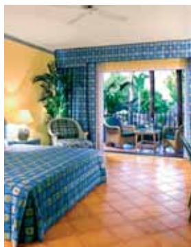
Hotel El Rodeo

Centralissima struttura ad appena 5 minuti a piedi dalla spiaggia. Dispone di ristorante a buffet climatizzato, bar, sala Tv, piscina e 200 camere dotate di bagno, telefono, Tv-sat, A/C, balcone e cassetta di sicurezza con supplemento.