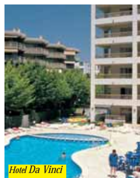
Hotel Da Vinci