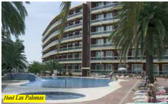
Hotel Las Palomas

È situato a 200 mt dalla spiaggia e 800 mt dal centro di Torremolinos. Dispone di sala Tv/giochi, bar, parrucchiere, due piscine, parco giochi e tennis. Programma di intrattenimento per adulti e miniclub. Camere con servizi privati, telefono con balcone su richiesta.