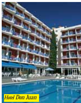
Hotel Don Juan