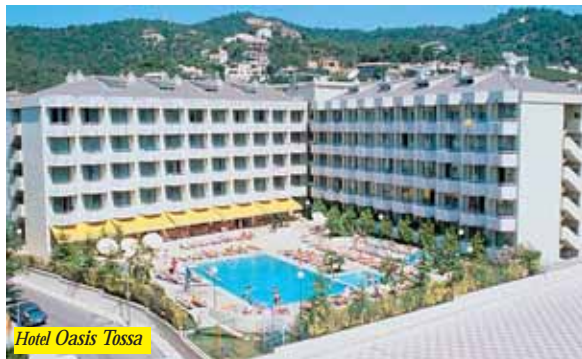
Hotel Oasis Tossa

Riduzioni: 3ª persona 30%; 1º bambino 2-12 anni 100%. Supplementi: PC €5/pers./gg., Sing. €27/pers./gg.