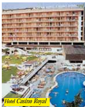
Hotel Casino Royal