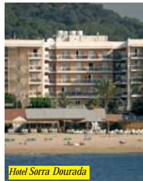
Hotel Sorra Dourada