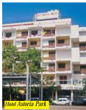
Hotel Astoria Park