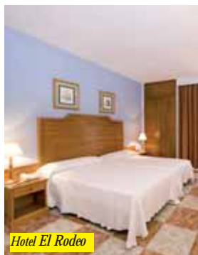
Hotel El Rodeo