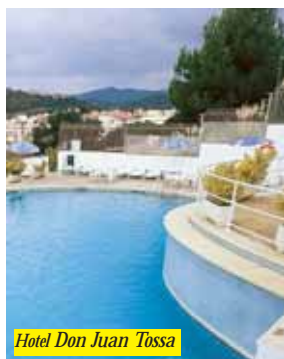
Hotel Don Juan Tossa