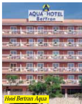
Hotel Bertran Aqua