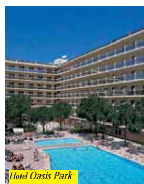
Hotel Oasis Park