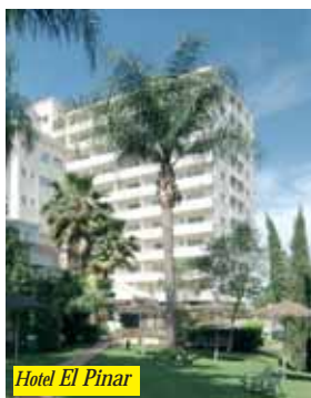
Hotel El Pinar

L'hotel è situato in una pineta a circa 1 km dal centro e dalle spiagge (collegamento con navetta). Dispone di reception, ristorante, sale conferenze, negozi, lavanderia, coiffeur, tennis, piscine, sauna, jacuzzi, palestre e minigolf. Programma di animazione e miniclub. Camere con servizi privati, Tv, telefono, A/C e balcone.