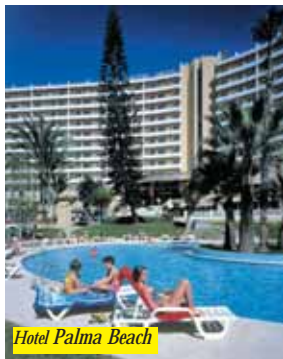
Hotel Palma Beach

L'hotel è situato sulla magnifica collina di Benidorm, a 800 mt dalla spiaggia di Levante, vicino a negozi, ristoranti, bar, e trasporti pubblici. La struttura dispone di reception 24h, sala conferenze, punto internet, ascensore, A/C nelle aree comuni, servizio lavanderia, bar, ristorante, mini club, discoteca, sala giochi, piscina, sauna, parcheggio e garage (alcuni servizi con supplemento). Le camere sono dotate di TV, minibar (con supplemento), TV, A/C individuale ed asciugacapelli.